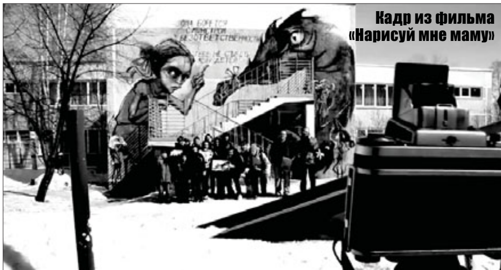
Кадр из фильма «Нарисуй мне маму»